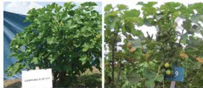
Tampilan genotipe No. 9 (Jet 2 Agribun) : kiri sedang berbunga, kanan berbuah.

Jet 2 Agribun variety is a plant with growth reaching more than 200 cm and has been released as new variety. Has an average yield potential of 1,078 kg / ha, Jet 2 Agribun variety is also resistant to P latus pest and has an oil content of 35.80%. This superior variety is potential to be developed as a renewable energy source.