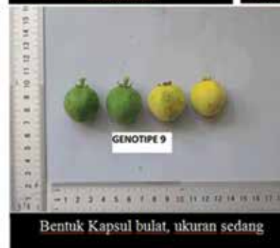
Bentuk Kapsul bulat, ukuran sedang