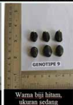
Warna biji hitam, ukuran sedang