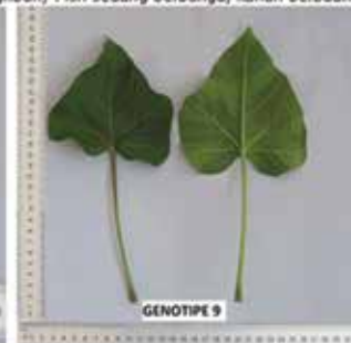
Intensitas pewarnaan antosianin pada tangkai daun : sangat lemah